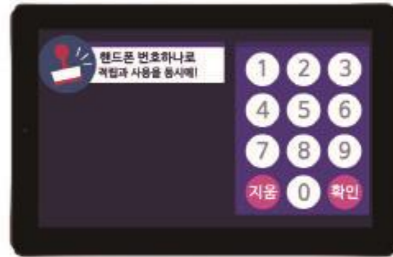
STEP 2 계산된 금액 입력 후 손님이 '핸드폰 번호'를 입력