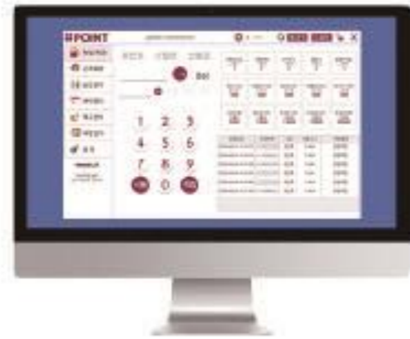
STEP 1 계산이 끝난 후 포스에서 적립 실행