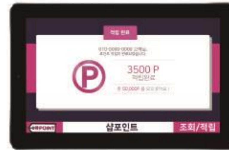
STEP 3 적립 완료 적립 내역 손쉽게 확인